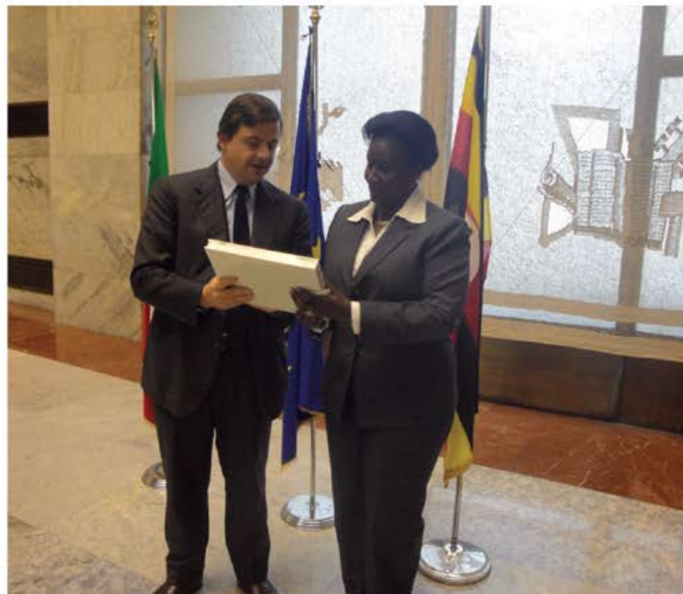
Il Ministro Amelia Kyambadde e il Vice Ministro Carlo Calenda / Hon Amelia Kyambadde, Minister of Trade, Industry and Cooperatives of Uganda and Hon Carlo Calenda, Vice Minister of Economic Development, Italy

Uganda's Minister of Trade, Industry and Cooperatives, Hon Amelia Kyambadde, has pointed to five areas of collaboration between Italy and Uganda, in their joint bid to promote trade and investment between the two friendly countries. She was responding to Hon Carlo Calenda, the Italian Deputy Minister of Economic Development, who received her at the Ministry Headquarters in Rome in late November. In his welcoming remarks, Calenda told Kyambadde that Italy was interested in defining concrete projects for collaboration with Uganda. For that reason, he was going to get together members of the Italian Steering Committee on Industrialisation so as to define areas of Italian investment in Uganda. Kyambadde outlined five areas of fruitful future collaboration between Italy and Uganda as strengthening the SMEs model and SMEs management, infrastructure, agro-business including processing and packaging, capacity-building across all the areas of collaboration and the promotion of the leather industry. Kyambadde had earlier met the Vice President of Emilia Romagna, to whom she expressed great admiration for the Italian model of cooperatives. She also had dinner with the head of the cooperative banks in Italy.