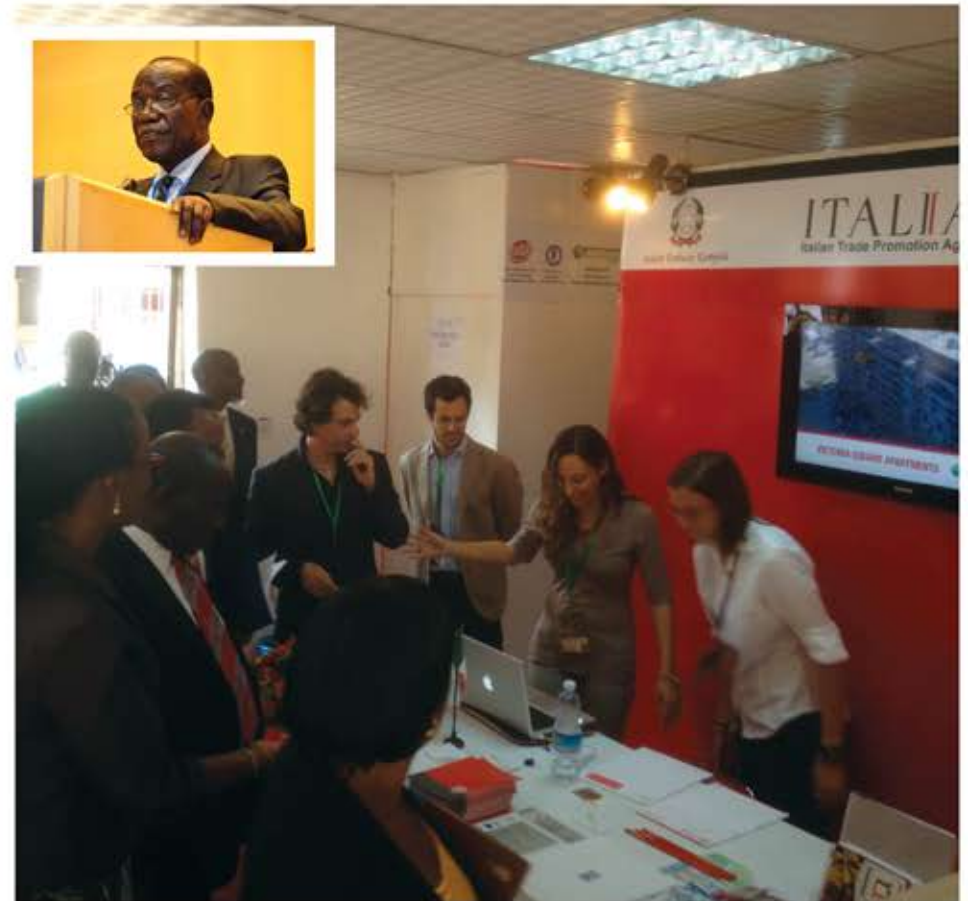
Il Vice Presidente dell'Uganda, Edward Sekandi (in alto), in visita allo stand italiano alla Fiera di Kampala / HE Edward Sekandi (inset above), Vice President of Uganda at the Italian stall